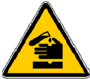
Simbolo del rischio chimico