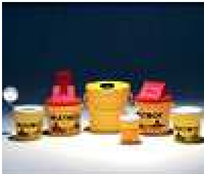
Contenitore di rifiuti sanitari pericolosi a rischio infettivo