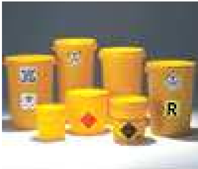
Contenitori di rifiuti sanitari pericolosi a rischio infettivo