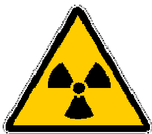
Simbolo del rischio radiologico

I locali all’interno dei quali possono essere presenti fonti artificiali di radiazioni sono contrassegnati con il seguente segnale: