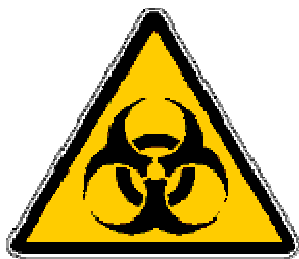
simbolo del rischio biologico